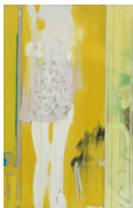
K. H. Hödicke, Negligé, 1965, Berlinische Galerie © VG Bild-Kunst, Bonn 2022, Foto: Roman März