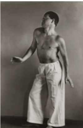
August Sander, Ohne Titel (Raoul Hausmann als Tänzer), 1929