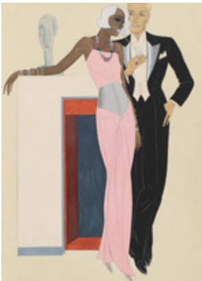
Gerd Hartung, Abendroben für Damen und Herren, 1932