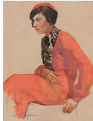
Lotte Laserstein, Dame mit roter Baskenmütze, um 1931, Berlinische Galerie © VG Bild-Kunst, Bonn 2022, Foto: Anja Elisabeth Witte