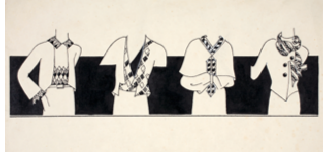
Hannah Höch, Leiste für „Die Dame“ Entwurf für den Ullstein-Verlag, 1916 – 1926, Berlinische Galerie