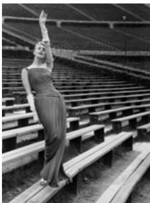
F.C. Gundlach, Charme, Chiffon und Phantasie, 1956