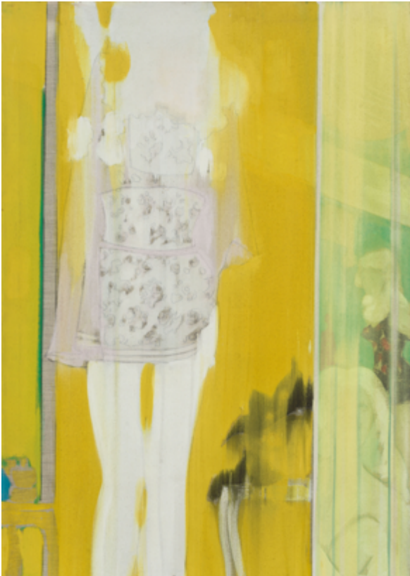
K. H. Hödicke, 'Negligé', 1965 © VG Bild-Kunst, Bonn 2022