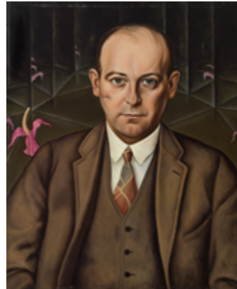
Christian Schad, Porträt des Schriftstellers Ludwig Bäumer, 1927, Berlinische Galerie © Christian Schad Stiftung Aschaffenburg / VG Bild-Kunst, Bonn 2022, Foto: Roman März