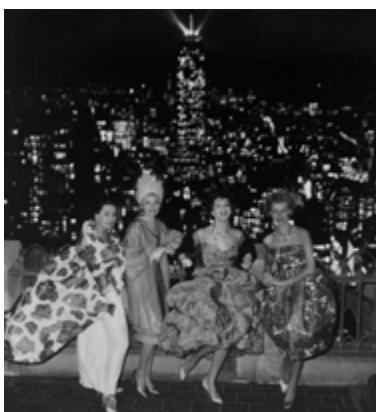
F.C. Gundlach, Berliner Mode, fotografiert auf dem Dach des RCA Building, New York 1958