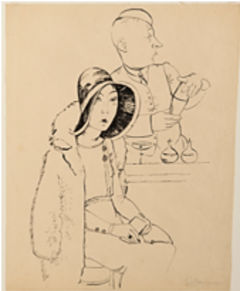
Jeanne Mammen, In der Bar, erschienen in: Simplicissimus, 1930, Jg. 35, Nr. 40, um 1930, Berlinische Galerie, © VG Bild-Kunst, Bonn 2022