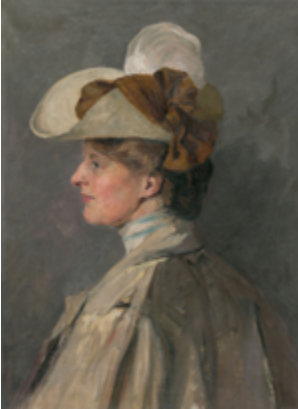
Leo von König, Porträt der Schwester des Künstlers, um 1912, Berlinische Galerie © Urheberrechte am Werk erloschen, Foto: Anja Elisabeth Witte