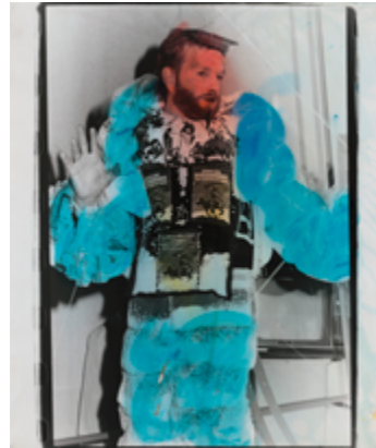
Rolf von Bergmann, Run-a-Ways (Serientitel), New York 1979