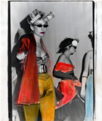
Rolf von Bergmann, Run-a-Ways (Serientitel), New York 1979