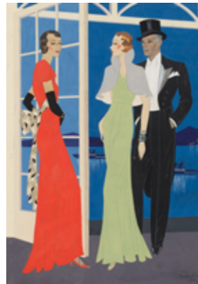
Gerd Hartung, Modezeichnung: Paar in Abendrobe, 1932