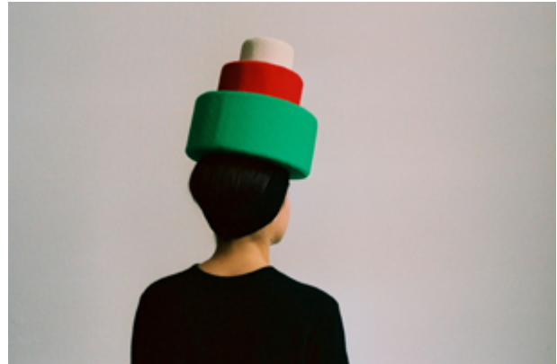
Wiebke Siem, Türmchenhut, dreifarbig, 1987, Foto: © Wiebke Siem