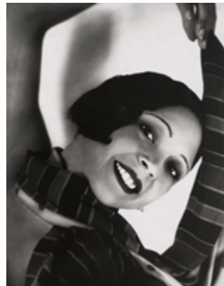
Yva, Ohne Titel (Eil' Dura), um 1930 © Urheberrechte am Werk erloschen, Repr.: Anja Elisabeth Witte