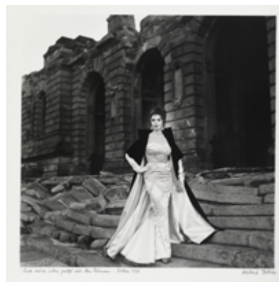
Herbert Tobias, ...und neues Leben protzt aus den Ruinen...Berlin 1954 © Berlinische Galerie / VG Bild-Kunst, Bonn 2022, Repro: Dietmar Katz