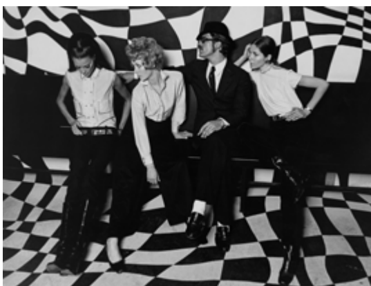
Rico Puhmann, Ohne Titel (Modeaufnahme), 1967