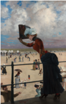
Franz Skarbina, Dame auf der Wandelbahn eines Seebads, 1883, Berlinische Galerie © Urheberrechte am Werk erloschen, Foto: Kai-Annett Becker

Modebilder – Kunstkleider Fotografie, Malerei und Mode 1900 bis heute