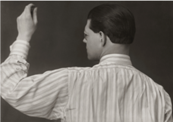
Raoul Hausmann, Hemden sind weit und blusenartig, um 1924